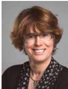
Ute Seifried Bürgermeisterin Stadt Singen

Deshalb wollen wir auch in diesem Jahr wieder mit zahlreichen Aktionen rund um den Weltfrauentag darauf aufmerksam machen, dass es immer noch eine erhebliche Schiefelage bei der Gleichberechtigung gibt. Zu allen Veranstaltungen sind uns Männer herzlich willkommen, denn nur gemeinsam werden wir Gleichberechtigung erreichen.